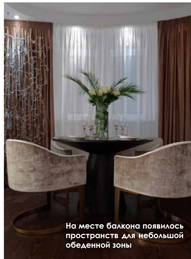
На месте балкона появилось пространство для небольшой обеденной зоны