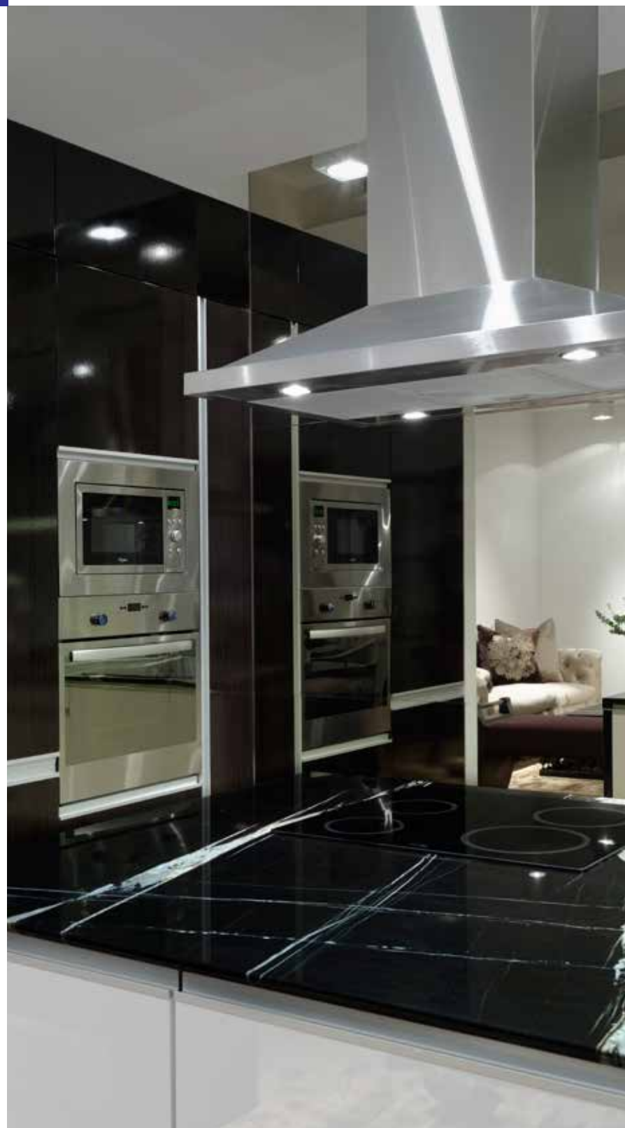
Заднюю стену кухни подностью закрывает изготовленное на заказ бронзовое зеркало, которое визуально увеличивает пространство в два раза

На завершающей стадии для декора стен Мила выбрала фотографии Кейт Мосс, которые помещены в картинные рамы. При желании в будущем их легко можно заменить на другие. На столах в гостиной и обеденной зоне, были размещены крупные цветочные композиции, которые оживляют пространство и придают ему домашний уют. ■