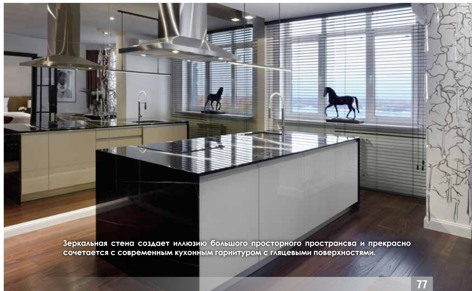
Зеркальная стена создает иллюзию большого просторного пространства и прекрасно сочетается с современным кухонным гарнитуром с глянцевыми поверхностями.