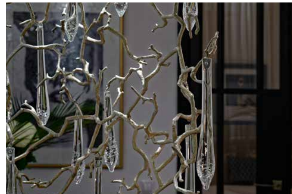
Изготовленная на заказ декоративная перегородка в виде дерева, которую украшают стеклянные подвески-капли, прекрасно сочетается с бронзовым зеркалом на кухне и отделяет столовую зону и гостиную, оставляя пространство открытым